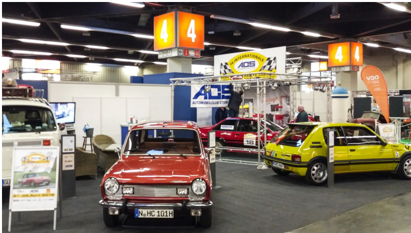
Messestand vom ACS auf der Retro Classic in Nürnberg