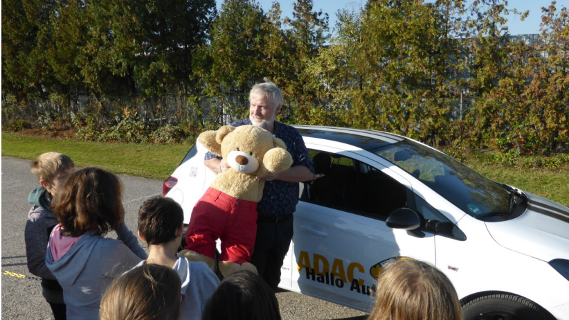
Verkehrserziehung an den Schulen in Fürth mit dem ADAC und ACS