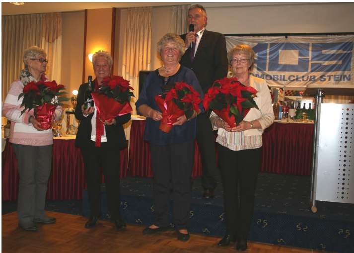
Die Damen, die Feuerspazen für den Steiner Weihnachtsmarkt produzierten