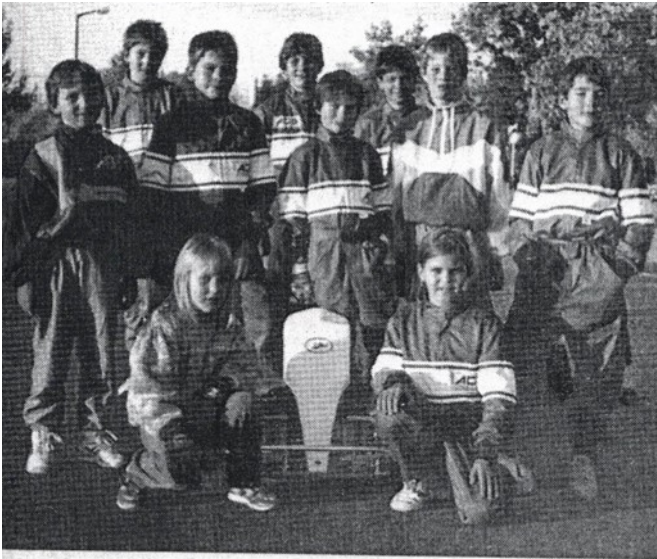
Jugend-Kart-Slalom Team des AC-Stein 1993

Der 1. ACS Jugend-Kart-Slalom am Kirchweihplatz im Jahr 1991 war die erste Veranstaltung dieser Art im Großraum Nürnberg und mit 46 Startern ein voller Erfolg.