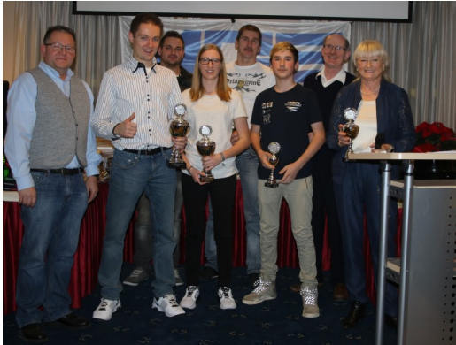
Sportler des Jahres